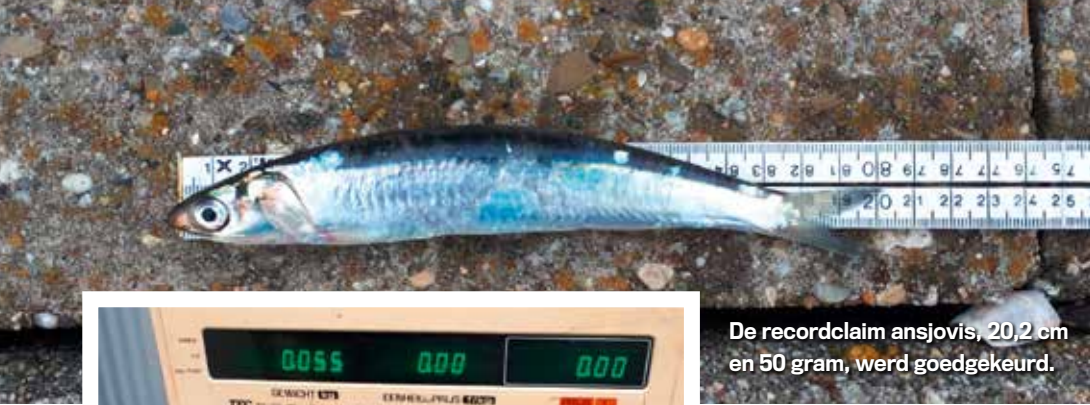
De recordclaim ansjovis, 20,2 cm en 50 gram, werd goedgekeurd.