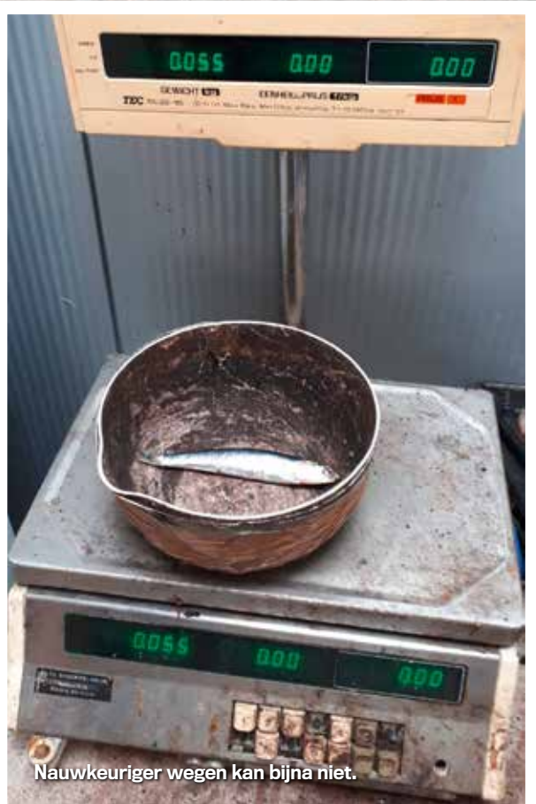
Nauwkeuriger wegen kan bijna niet.

en verbreekt daarmee het oude record van 20 cm en 50 gram van H. Boer uit Krabbendijke. Het record staat met dit grote exemplaar goed scherp. Zou het in 2020 verbroken kunnen worden?